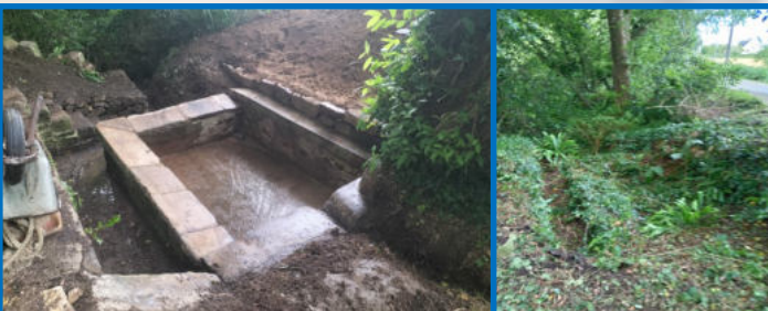
Chantier du lavoir de Kergoc